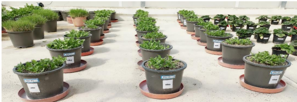
شکل ۱- طرح گلدان‌های آزمایشی در گلخانه

طرح آزمایشی و تیمارها: این آزمایش به صورت فاکتوریل و در قالب طرح کاملاً تصادفی به صورت گلدانی با دو فاکتور کم آبیاری و بیوچار در سه تکرار و در مجموع با نه تیمار و ۲۷ گلدان انجام شد. فاکتورهای آزمایشی شامل سه سطح آبیاری کامل (۱۰۰)، کم آبیاری (۷۵) و ۵۰ درصد نیاز آبی گیاه گشنیز به ترتیب (a1, a2, a3) و سه سطح کاربرد صفر، ۲/۵ و ۵ درصد وزنی هر گلدان بیوچار