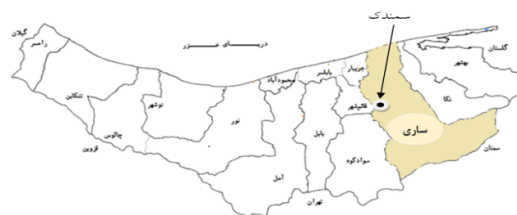
شکل ۱- موقعیت منطقه مورد مطالعه

بر این اساس و به منظور شناسایی علت گرفتگی تحقیق حاضر انجام شد. با توجه به اهمیت کارکرد قطره‌چکان‌ها در افزایش و یا کاهش شاخص‌های