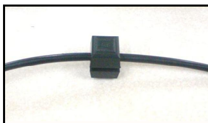
شکل ۱. مغناطیس مورد استفاده در پژوهش

آب مصرفی افزایش یافت. افزایش ایجاد شده از نظر آماری معنی‌دار بود.